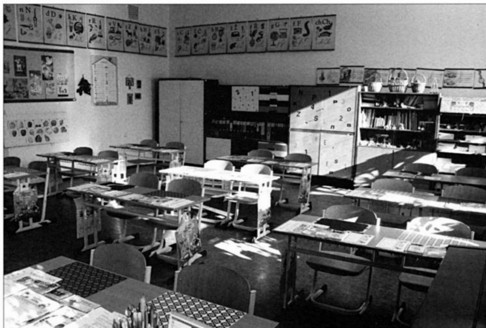
Třída je připravena na příchod prvňáčků